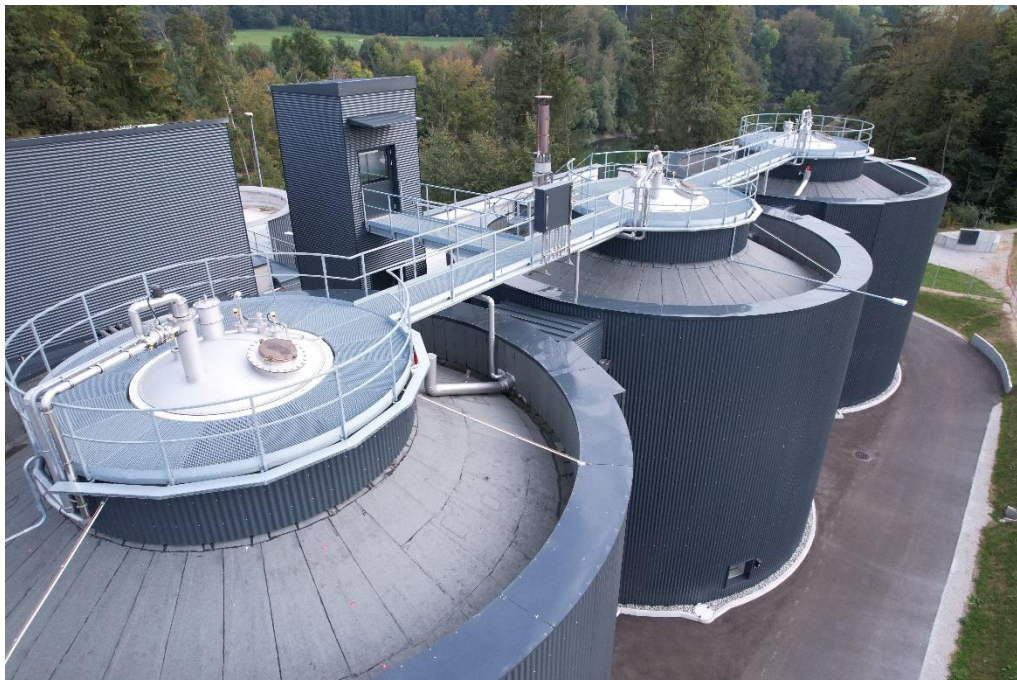
Traitement des boues - Nouveaux digesteurs de 1'500 m 3 chacun